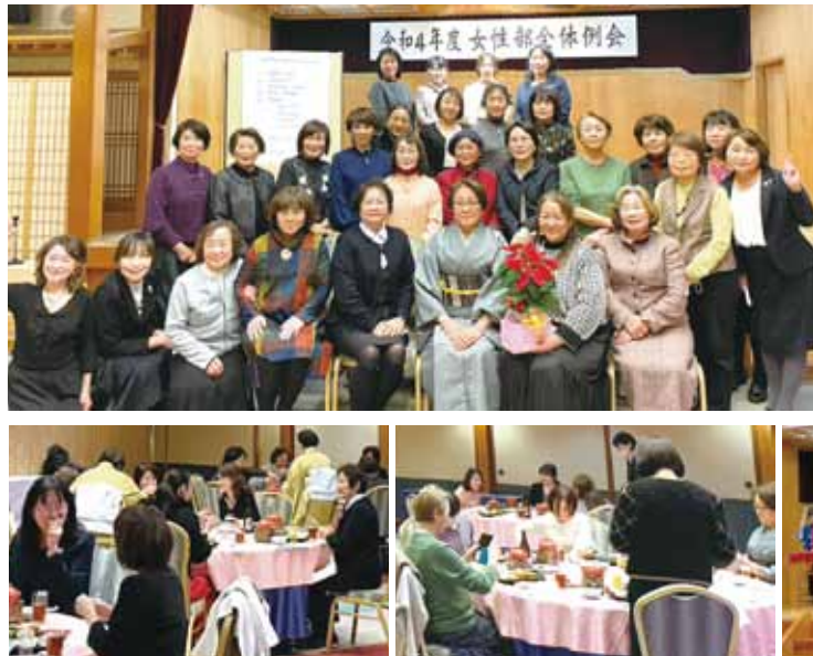
◎景品の協賛をいただきました。

第2回目の全体例会にたくさんのご参加をいただきありがとうございました。抽選会・津軽三味線の演奏と、本年度の事業を動画にまとめた上映会を行いました。各行事にご参加くださった方々、また参加ができなかった方にも楽しんでいただけたと思います。これからも女性部行事にたくさんの方のご参加をお待ちしております。